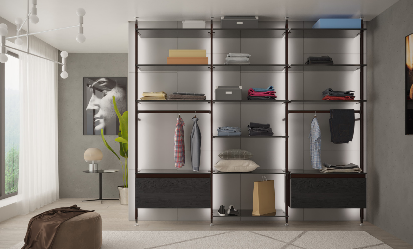
Гардеробна система «ПІДЛОГА-СТЕЛЯ», специфікація для глибини каркаса 295мм і 3-х секцій по 900мм